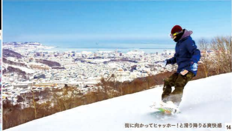
街に向かってヒャッポー! と滑り降りる爽快感 14