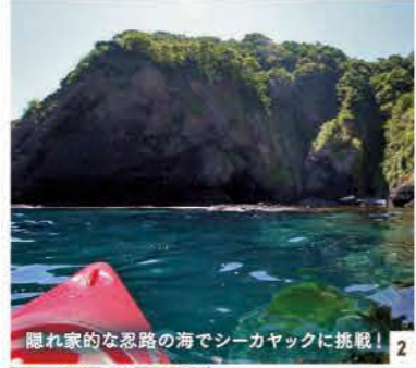
隠れ家的な忍路の海でシーカヤックに挑戦! 2