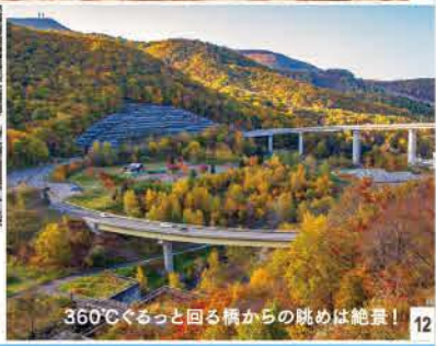
360°Cぐるっと回る橋からの眺めは絶景! 12