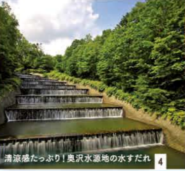
清涼感たっぷり! 奥沢水源地の水すだれ 4