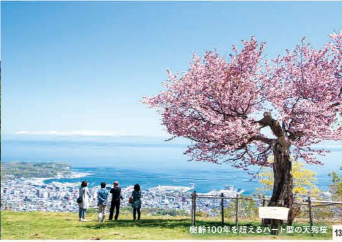
樹齢100年を超えるハート型の天狗桜 13