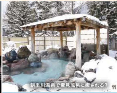
朝里川温泉で雪見風呂に癒される? 11