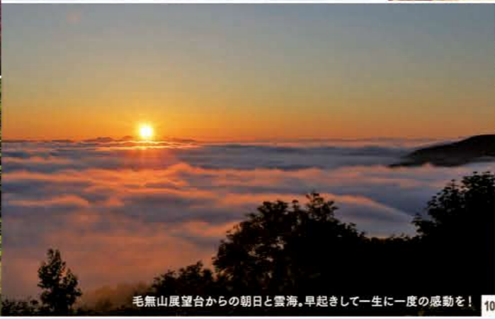
毛無山展望台からの朝日と雲海。早起きして一生に一度の感動を! 10