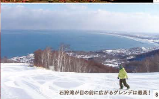
石狩湾が目の前に広がるグレンデは最高! 8