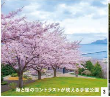
海と桜のコントラストが映える手宮公園 3