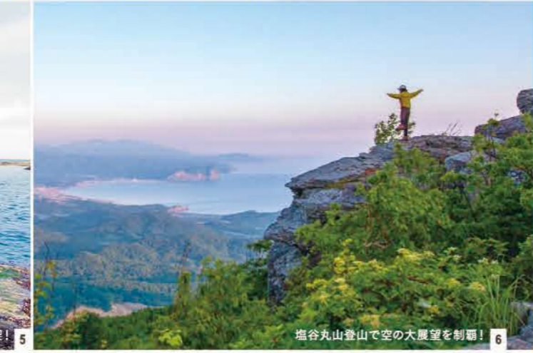
塩谷丸山登山で空の大展望を制覇! 6