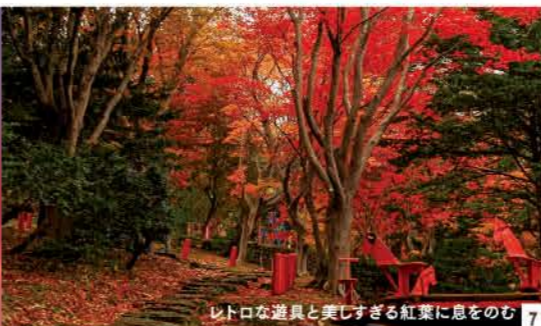
レトロな道具と美しすぎる紅葉に息をのむ 7