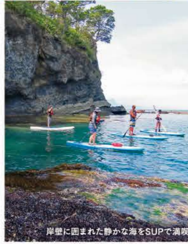
岸壁に囲まれた静かな海をSUPで満喫! 5