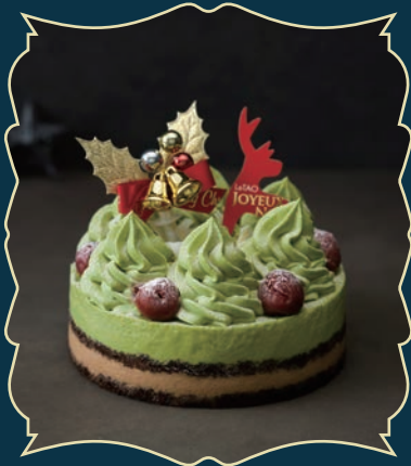
FORÊT PISTACHE NOËL フォレピスターシュノエル