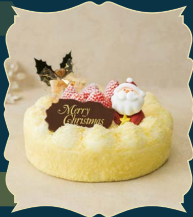
CHRISTMAS DOUBLE クリスマスドゥーブル