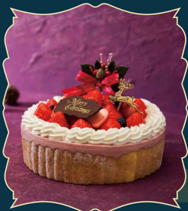
STRAWBERRY CHARLOTTE 贅沢いちごのシャルロット

ケーキ本体には1%未満、シャンパンソースには1%以上のアルコールが含まれています。