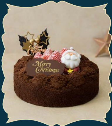
CHRISTMAS CHOCOLAT DOUBLE クリスマスショコラドゥーブル