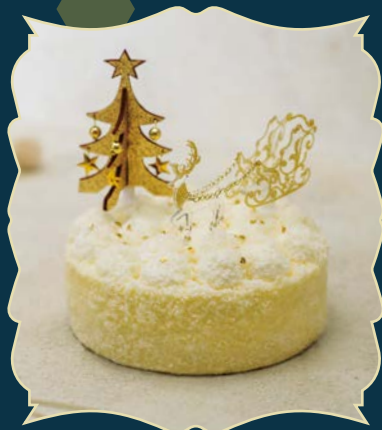
CHAMPAGNE DOUBLE シャンパンドゥーブル