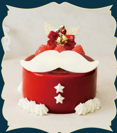
SANTA CLAUS サンタクロース