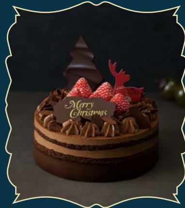
FORÊT CHOCOLAT NOËL フォレショコラノエル