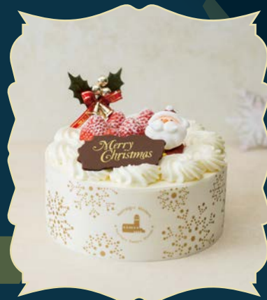
STRAWBERRY CHRISTMAS 苺のクリスマス